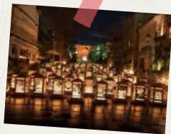
ながの灯明まつり