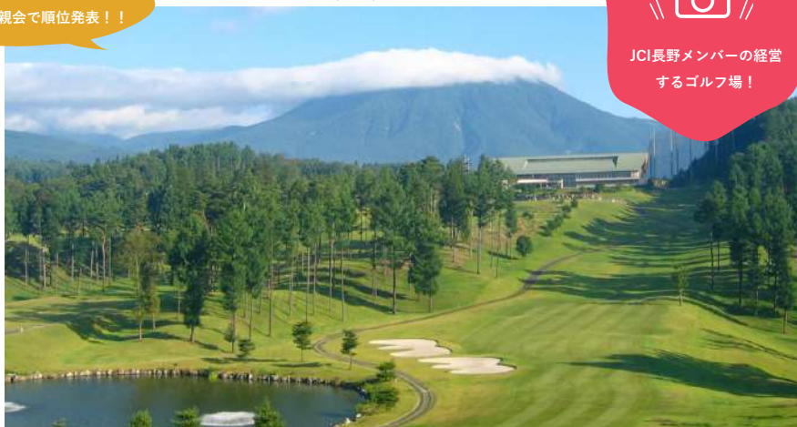
信濃ゴルフ倶楽部