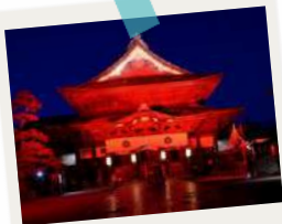
JCI長野の事業「ながの灯明まつり」