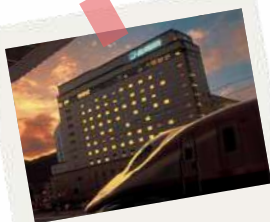
メトロポリタン長野